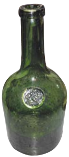
Grön glasflaska med sigill SB GB Strömbäcks glasbruk.

1800-talets inledande decennier blev en blomstringstid för Strömbäcks glasbruk. Handelshuset Åberg och