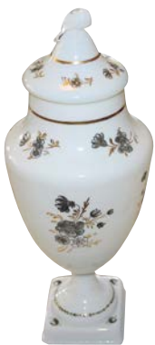
Potpourriurna i vitt flussglas.

En ny ugn togs i bruk i Strömbäck den 4 december 1752. Denna visade sig hålla bättre än de två föregående och den klarade en relativt omfattande produktion fram till den 8 november 1753. Tillverkningen utgjordes till stora delar av grönt fönsterglas, som hade säker avsättning, men även av många sorters enkla bruksföremål, särskilt buteljer och flaskor i olika storlekar. Enbart under den nämnda perioden blåstes 10 751 flaskor, som rymde 2/3 stop (ca 0,86 liter). Trots att bruket fick en mer ordnad ledning under direktören Per Fallander, drabbades man nu av ett helt års stillestånd. Som orsak anfördes brist på ved, men svårigheter att få fram råvaror för glasframställningen torde även ha inverkat. Då ett nytt stopp inträffade den 15 mars 1755 av liknande orsaker, hade bruket sedan starten i juli 1751 varit igång i endast ett år och nio månader.