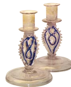
Ljustakar i glas med inblåst blå glasmassa.