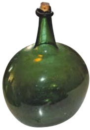
Ballongflaska i grönt glas.

23 juli ingicks ett avtal mellan Malmerfeldt och fyra bönder om förvärv av mark för det nya glasbruket, Norrlands första, vid Ströms vattudrag, mindre än två mil sydöst om Umeå. Platsen var väl vald med skyddad hamn för frakt av råvaror och färdigvaror, god tillgång på ved och lämplig lera samt vattenkraft för att driva kvarn och stamp.