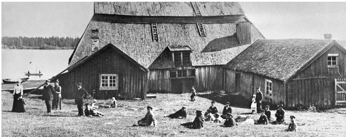
Hytta vid Strömbäcks glasbruk.