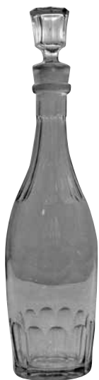
Kägelformad glaskaraff med propp.

vetskapen om att det sedan i augusti fanns kolerasmitta i huvudstaden vidtogs inga försiktighetsåtgärder vid lossningen. Under de följande veckorna dog tjugotre människor i det lilla samhället. De begravdes skyndsamt på en tallhed några hundra meter nordväst om bruket, där kolerakyrkogården i dag minner om den tragiska händelsen. Även om koleraepidemin naturligtvis var ett mycket hårt slag mot verksamheten vid bruket återgick dock livet så småningom till det normala.