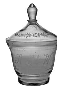
Låg lockpokal i glas. Etsat monogram och ranka.