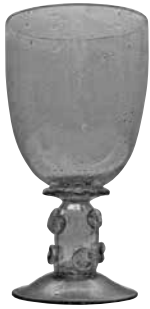
Bägare av renässanstyp på fot med påklippta glasknoppar.

halverad summa skulle räcka till ett slip- och polerverk med vars hjälp man skulle kunna framställa spegelglas genom blåsning.