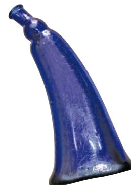
Kruthorn i blått glas.

Hösten 1853 drabbades Strömbäck av kolera. Den 3 november anlände skonaren Ceres till hamnen i Strömbäck, som vanligt medförande förnödenheter på återresan från Stockholm dit den fraktat glasvaror. Trots